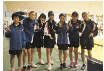
【卓球部女子の生徒たち】

10月は、新型コロナウイルス拡散防止のため実施が心配された市新人体育大会が、保護者や生徒の参加や観戦を制限される中開催されました。1・2年生は、暑い夏の中での練習を乗り越えて、初めての大きな大会の参加となりました。どの部も最後まで諦めない頑張りを見せてくれました。勝つことも大事ですが、敗戦の中からも多くのことを学び取ってくれたのではないのでしょうか。その中でも、創部2年目の卓球部女子が団体戦で第三位になり、県大会出場を勝ち取りました。おめでとうございます。PTAから正門右わきに看板を寄贈していただきました、ありがとうございます。